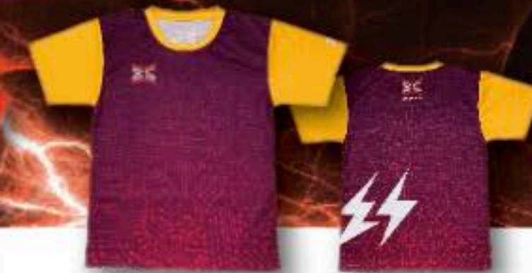
FRONT ユニフォーム ¥5,500+税 ポリエステル100%