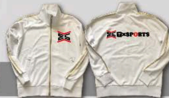
EJ-001 ホワイト/ゴールド