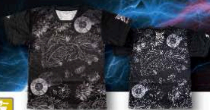
FRONT ユニフォーム ¥5,500+税 ポリエステル100%