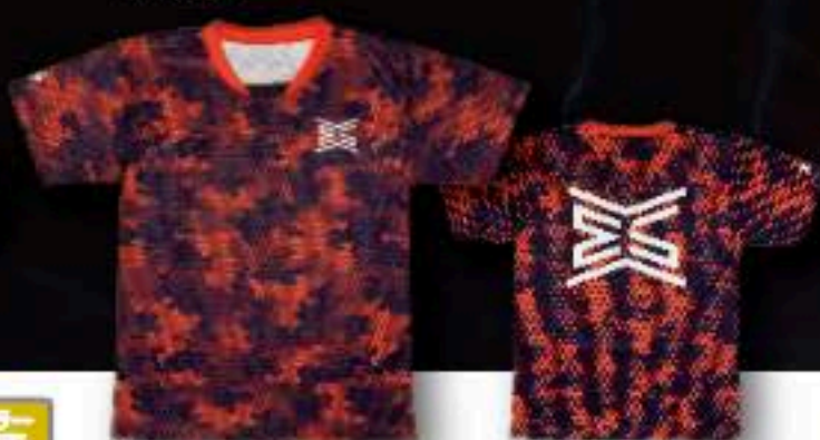
FRONT ユニフォーム ¥5,500+税 ポリエステル100%