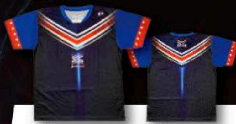
FRONT ユニフォーム ¥5,500+税 ポリエステル100%