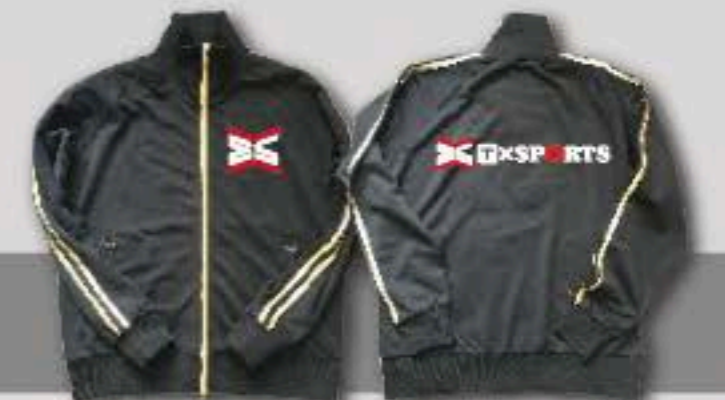
EJ-002 ブラック/ゴールド