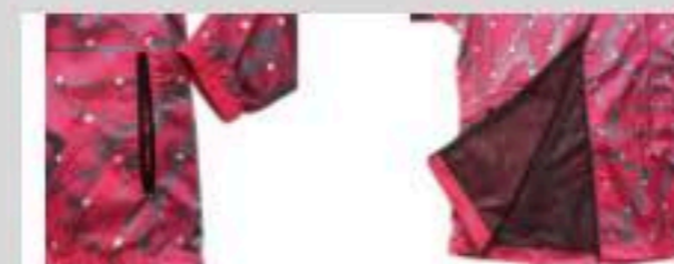
ポケットジッパータイプ