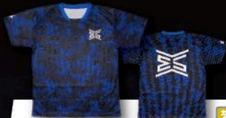
FRONT ユニフォーム ¥5,500+税 ポリエステル100%