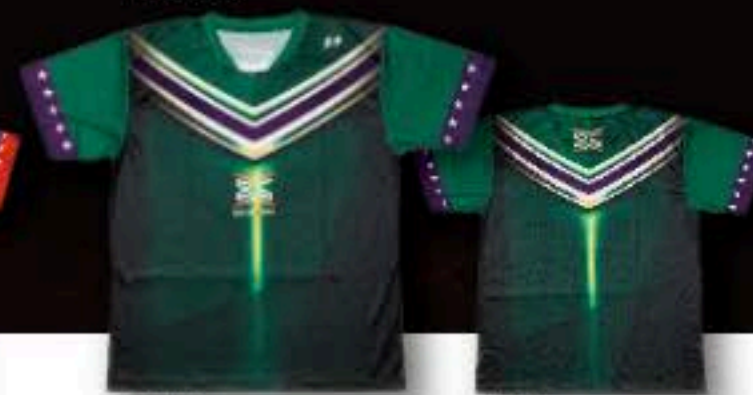
FRONT ユニフォーム ¥5,500+税 ポリエステル100%