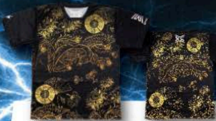
FRONT ユニフォーム ¥5,500+税 ポリエステル100%