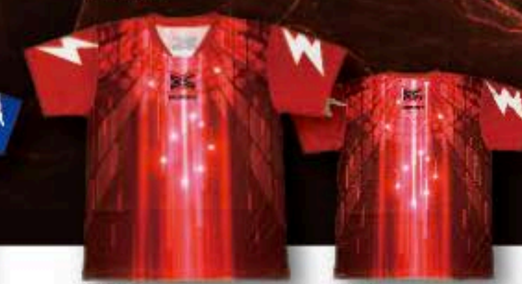
FRONT ユニフォーム ¥5,500+税 ポリエステル100%