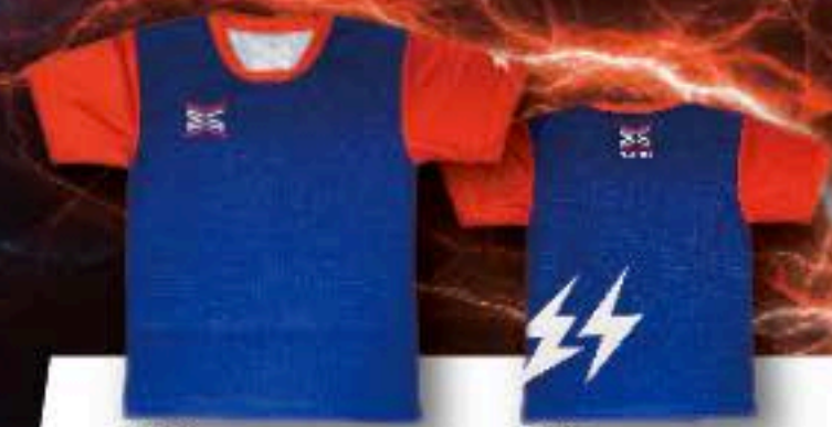
FRONT ユニフォーム ¥5,500+税 ポリエステル100%