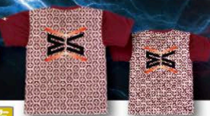
FRONT ユニフォーム ¥5,500+税 ポリエステル100%