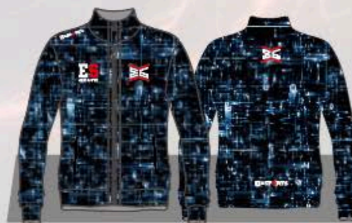
EJ-051 FRONT BACK