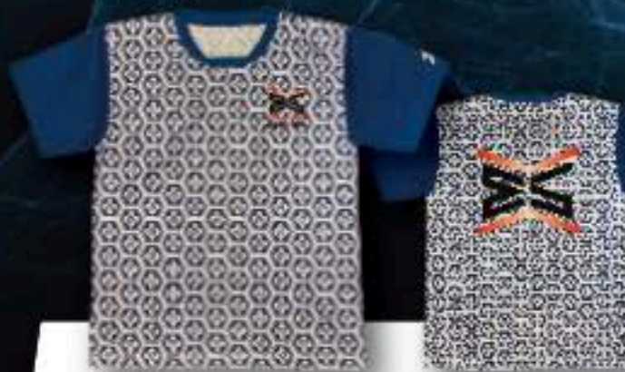
FRONT ユニフォーム ¥5,500+税 ポリエステル100%