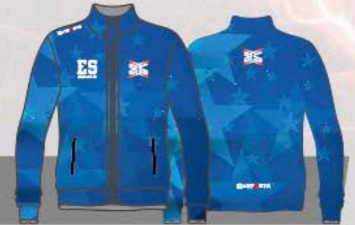
EJ-052 FRONT BACK