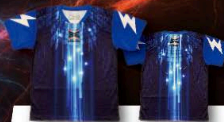
FRONT ユニフォーム ¥5,500+税 ポリエステル100%